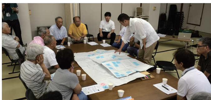
集落点検の会合の様子