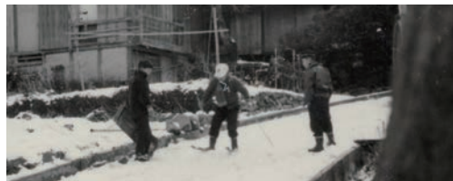
竹スキーで遊ぶ子供たち

ふなさか組では、現在も船坂の古い写真を募集中です。昔の写真をお持ちの方は、ぜひお申し出下さい！