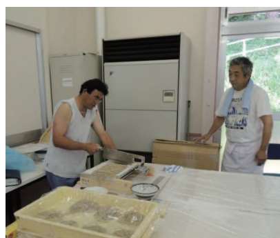
遊休地で育てたそばの加工