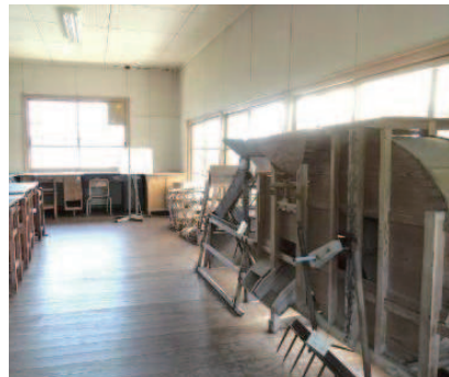
古道具・古民具の展示