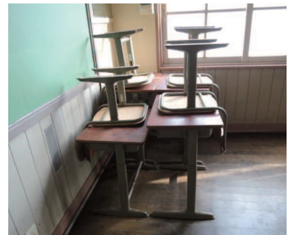
当時の椅子や机の活用