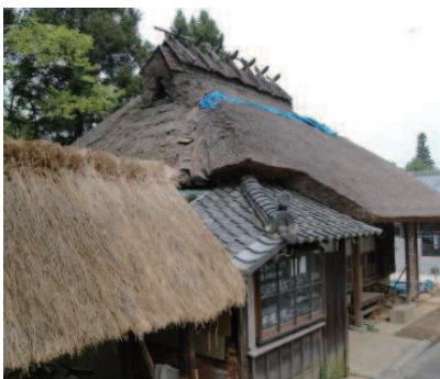
古民家改修・茅葺体験