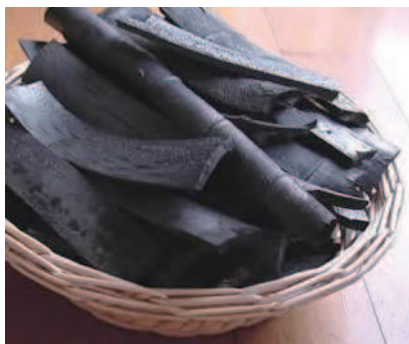
竹林管理を兼ねた竹炭づくり