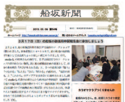
船坂新聞の閲覧コーナー