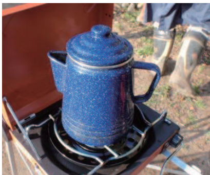
野良着で入れるカフェ