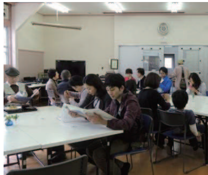
ランチのふるまい