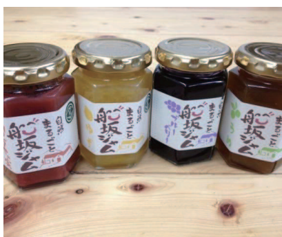
船坂食材にこだわった特産品づくり