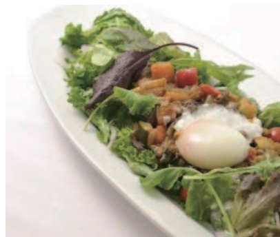
船坂産の野菜カフェ