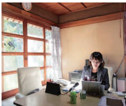
サテライトオフィス