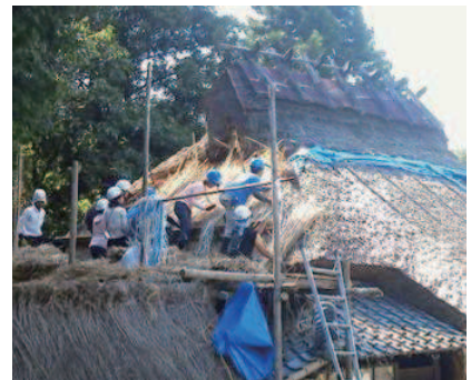
地域の技術に触れる