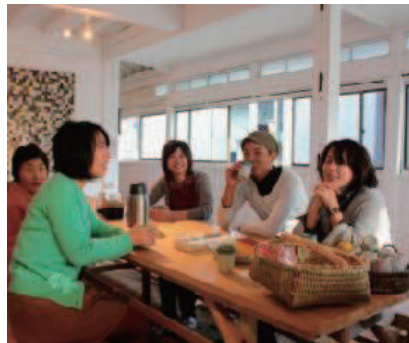
気軽な立ち寄り場