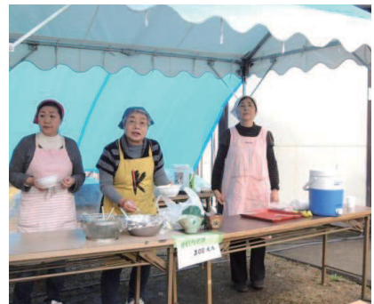
ふれあい広場（収穫祭）