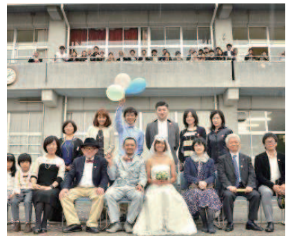
結婚式・金婚式・銀婚式