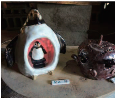
サークル活動の作品展示