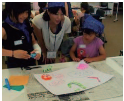
住民同士が教えあう教室