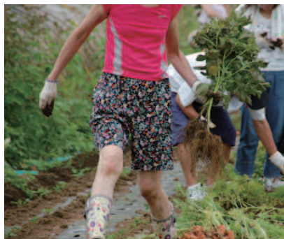
市内の児童向けの体験学習