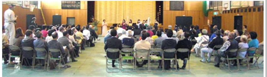
10月18日(土)のオープニングセレモニー(体育

第3回目となる今年は、作家公 募、イベント公募、入場料と初も のづくしでスタートしましたが、 皆さんの努力のおかげで順調に進 んでいます。