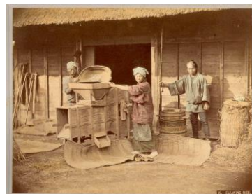
ウィキペディア「唐箕(とうみ)」より

「部屋の入り口を入ると、床に大きな船坂地域の地形模型が置いてあり、模型の要所要所には小さな旗が立っている。壁面には、昔から今までに写された船坂のいろんな写真が沢山貼られていて、写真の下には説明が書かれている。旗の数字と同じ壁面の数字を見つけると、旗の立っている場所で写した写真がある。部屋の片隅のカウンターには、地域の語り部が座っていて尋ねれば説明もしてくれる。その横には机と椅子もあり、ゆっくり資料を見ることもできる。旗と写真は、次々と増え、または次々と取り替えられ、いつまでも完成しない資料館。隣の小部屋には、昔の道具が一つ置いてあり、その道具の細かい説明が書かれていて手で触ることもできる。農機具や寒天道具は数ヶ月毎に展示替えされる。このような日本に一つしかない資料館はどうでしょう？」(船坂小学校跡施設活用推進委員会)