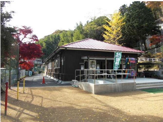
(旧船小管理運営委員会)

現在、西宮市が地域と協議を進めているのは、28年度から市が所管する西宮市立(仮称)船坂里山学校について、(仮称)船坂里山学校管理運営委員会に委託するというものです。27年度中に西宮市長が条例で指定管理者を指定し、28年度から施設の使用許可を与えます。