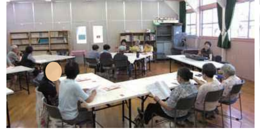
(旧船坂小学校管理委員会)