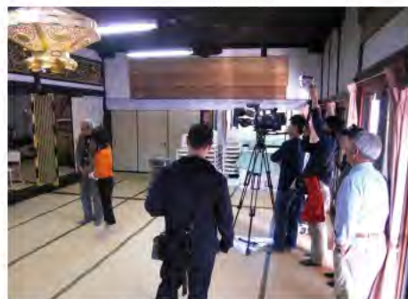
撮影の様子(善照寺)

月曜 12:00、火曜 8:00と21:00、水曜 22:00、木曜 14:30、金曜 23:30、土曜 17:15と深夜 0:15、日曜 16:30と18:45。 (放送時間:各15分間)