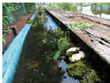
シュレーゲルあおがえるの産卵 (プールサイドの苔の中)