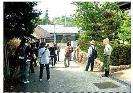
5月26日作家船坂見学会