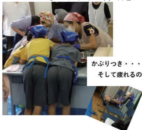
かぶりつき・・・ そして疲れるの図

そば職人か!!」「今日の晩御飯はおそば〜」「うれしいな〜おそば食べられる」と話されていた6組のお蕎麦は、さぞかし美味しかったことでしょうね♪