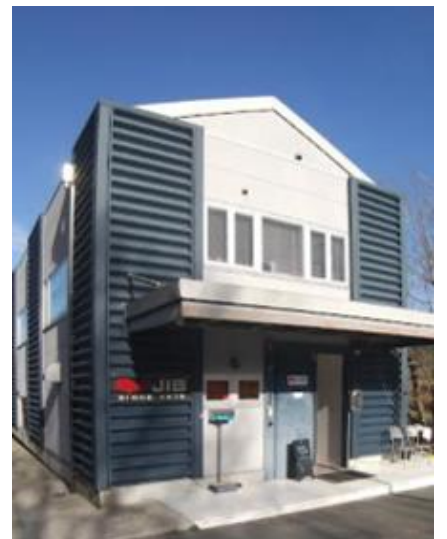
(編集委員 中尾 尚美)

店内には大きな窓がありますので、自然がいっぱいの船坂の景色を眺めながらほっと一息ティータイムを楽しまれてもいいですね♪