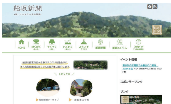
現行のホームページ

現行のホームページは、2014年より公開しております。当初は西宮流(にしのみやスタイル)の方にご協力いただき、立ち上げから使い方のレクチャー、しばらくの間の管理などを行っていただきました。ちなみに、それより以前には、「船坂盛り上げ隊」のホームページとして、船坂新聞立ち上げと同時にインターネットから見ていただけるようにすでにサイトが作られていたのです。